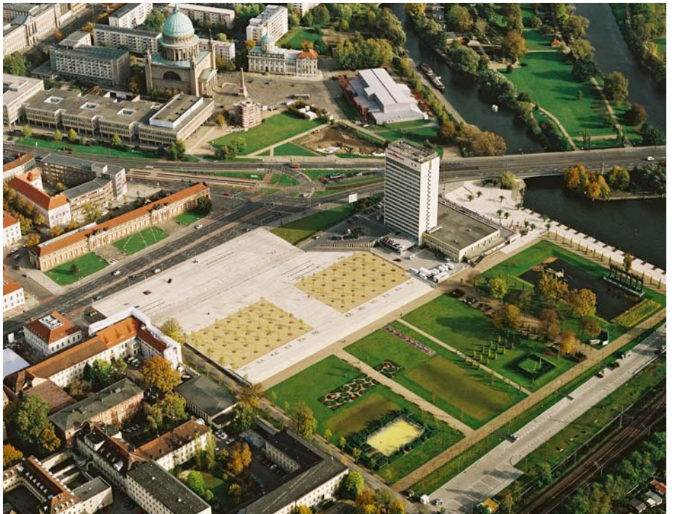
Blick auf den Lustgarten