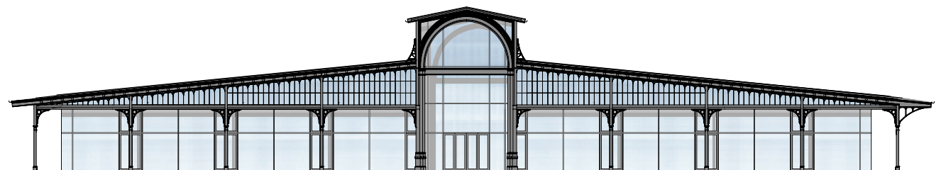
Ansicht historische Fassade Nord